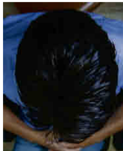
Antes (izq.) y después (dcha.) de un sistema de integración capilar en IMD.